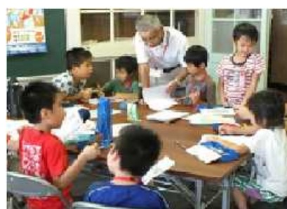
地域の課題に取り組む活動の一例 (宿題サロン)