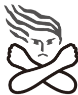
女性に対する暴力根絶のためのシンボルマーク

また、市の「配偶者暴力相談支援センター」では、女性が抱える悩みについて相談に応じるほか、被害者の安全と自立のために必要な支援を行っています。秘密は守られますので、安心して相談してください。